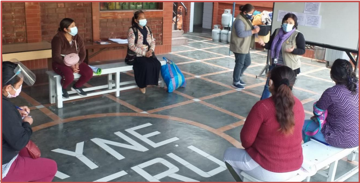
Formación de capacidades, Empoderamiento de la mujer – Comedor Puesto Piedra