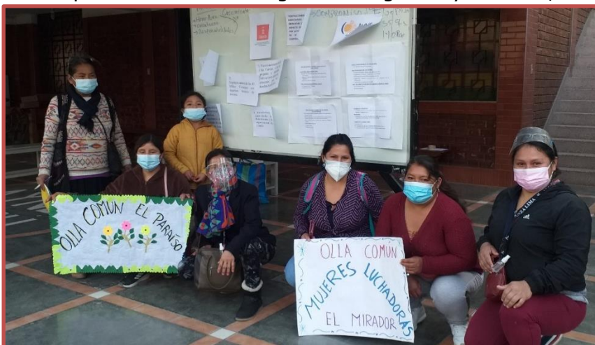
Mujeres organizadas en Ollas comunes para enfrentar crisis alimentaria Puente Piedra