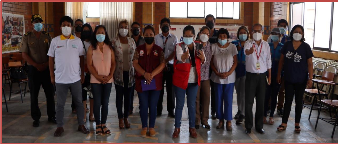
Mesa de concertación para la lucha contra la pobreza - Ancón