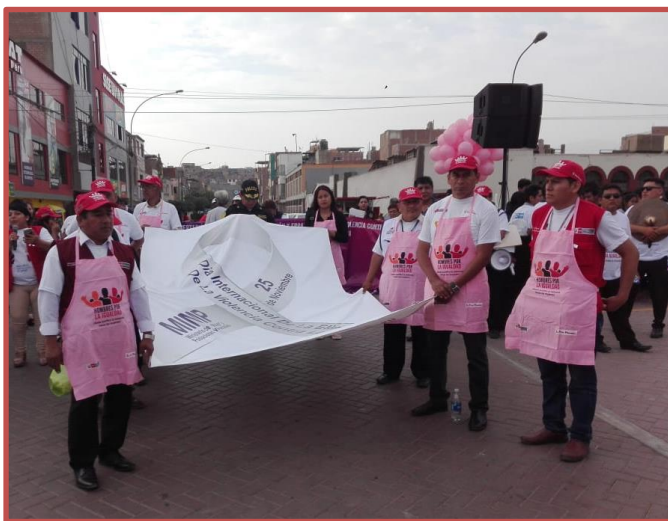
PASACALLE POR LA NO VIOLENCIA – IGUALDAD DE GÉNERO

La desigualdad vulnera también el derecho a la salud sexual y reproductiva: acceso y uso de métodos anticonceptivos sobre todo en el caso de mujeres adolescentes, educación integral y certera sobre sexo y sexualidad, conocimiento de los riesgos que pueden correr y su vulnerabilidad ante las consecuencias adversas de la actividad sexual sin protección, y la posibilidad de acceder a la atención de salud sexual. Acceso y participación en espacios de toma de decisión: (en las elecciones presidenciales, al congreso, a elecciones regionales y locales, el cargo de decisión el sector público y privado). Los derechos económicos y sociales, que se evidencia en la desigualdad educativa, desigualdad económica (laboral y productiva) en el acceso, control y uso de tecnologías de la información y comunicación.